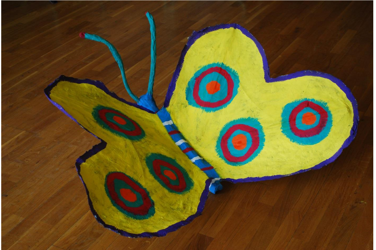
Metulj, učenci 3.a