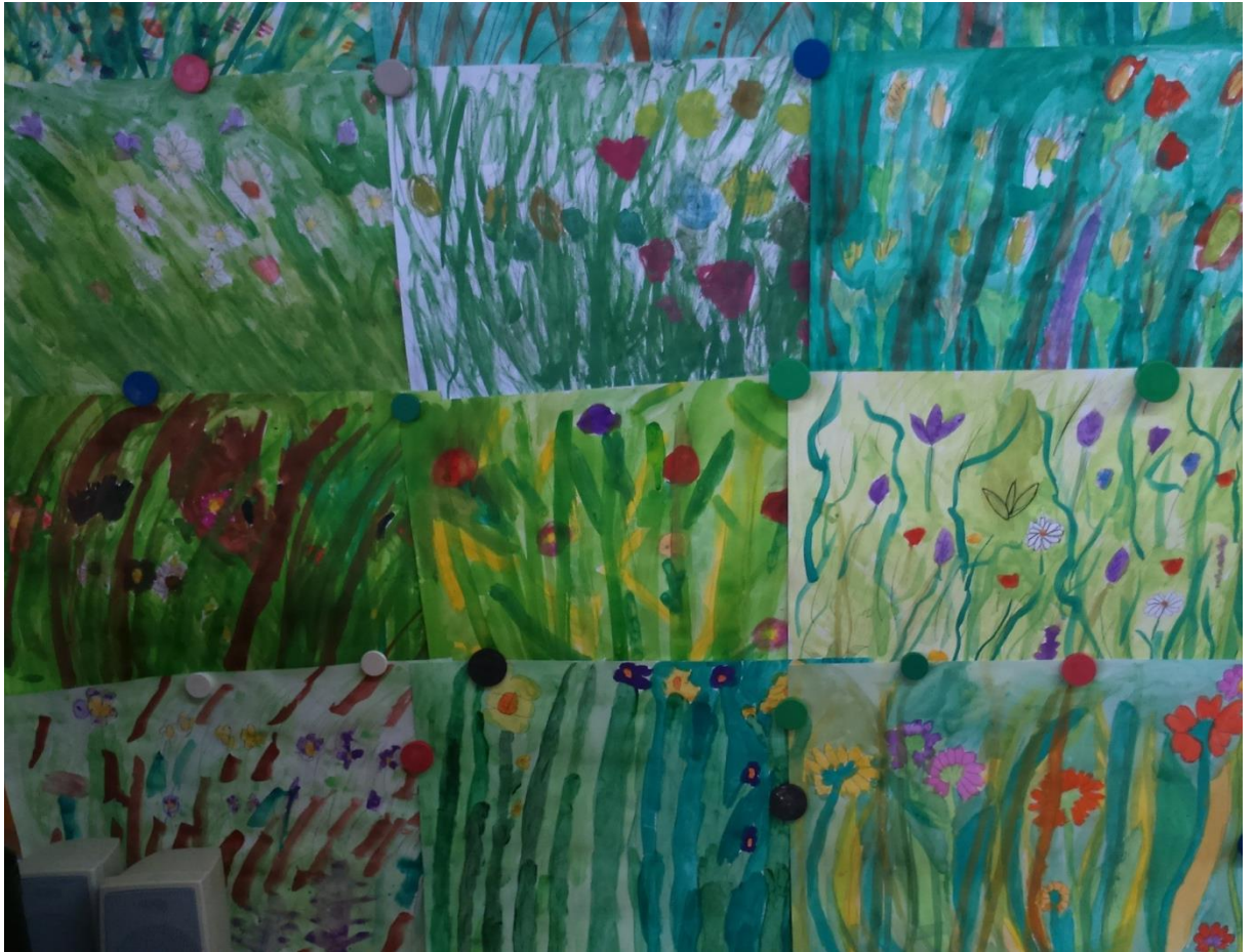
Cvetoči travnik, 2.a