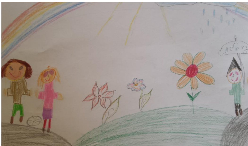
Stela Titan, 1.a