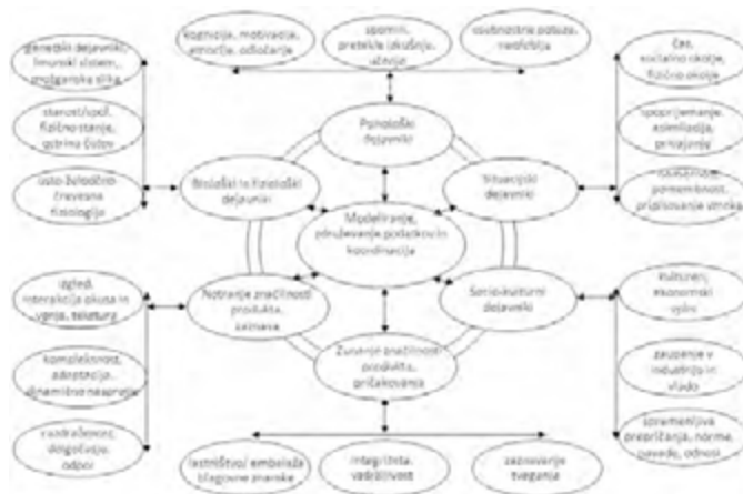
Slika 2. Dejavniki, ki vplivajo na izbiro hrane in pijače (prirejeno po Köster, 2009).

Köster (2009) pa predlaga še drugačno delitev in navaja, da je izbira hrane posledica interakcije bioloških in fizioloških dejavnikov, psiholoških dejavnikov, situacijskih dejavnikov, socio-kulturnih dejavnikov, zunanjih značilnosti produkta in pričakovanj ter notranjih značilnosti produkta in zaznav (glej sliko 2).