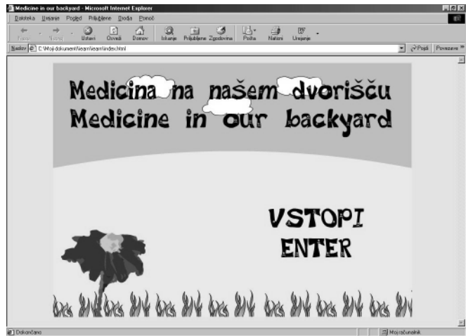
Slika: naslovna spletna stran projekta