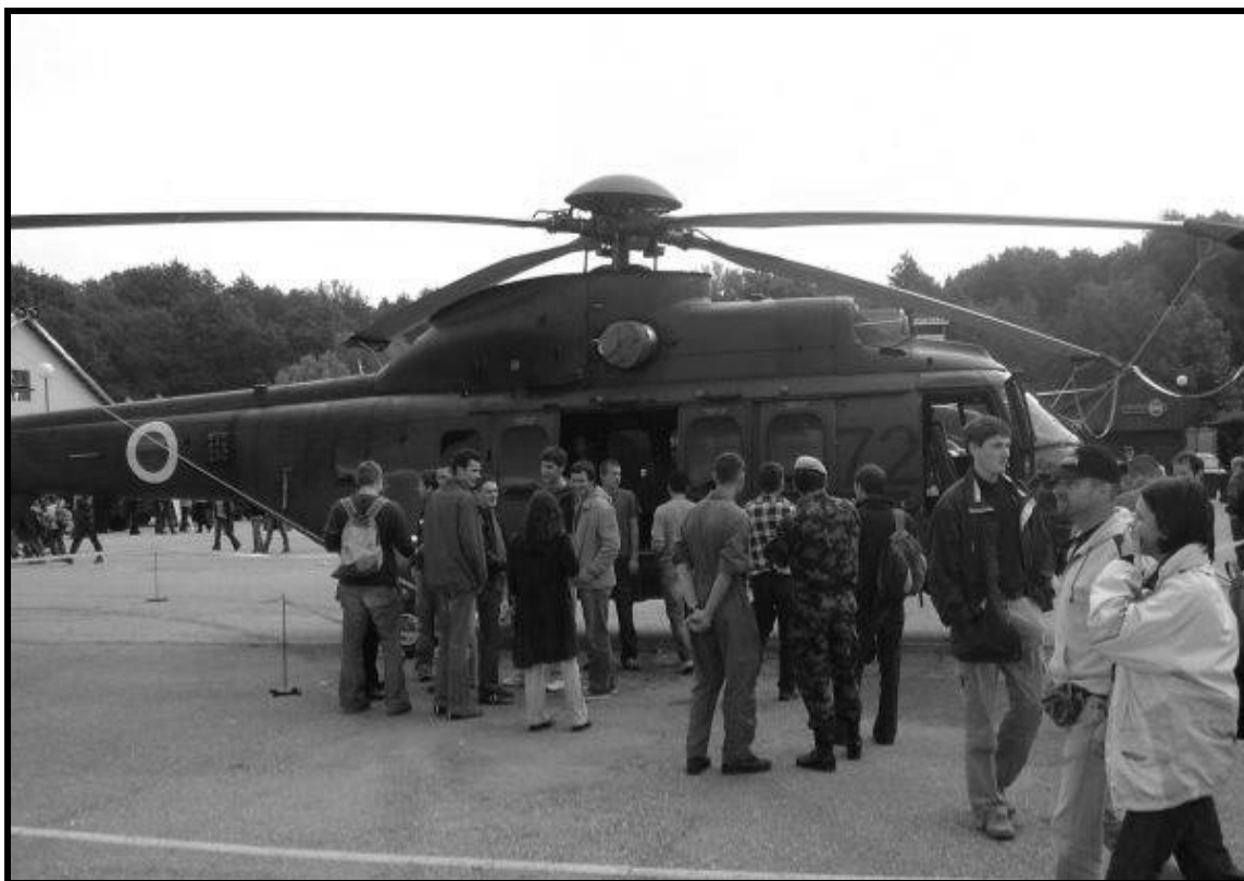
(Pomurski sejem v Gornji Radgoni)

(Strožji ukrepi v primeru kršitve pravil sta tudi povrnitev namerno storjene škode in prepoved udeležbe na naslednji ekskurziji ali izletu.)