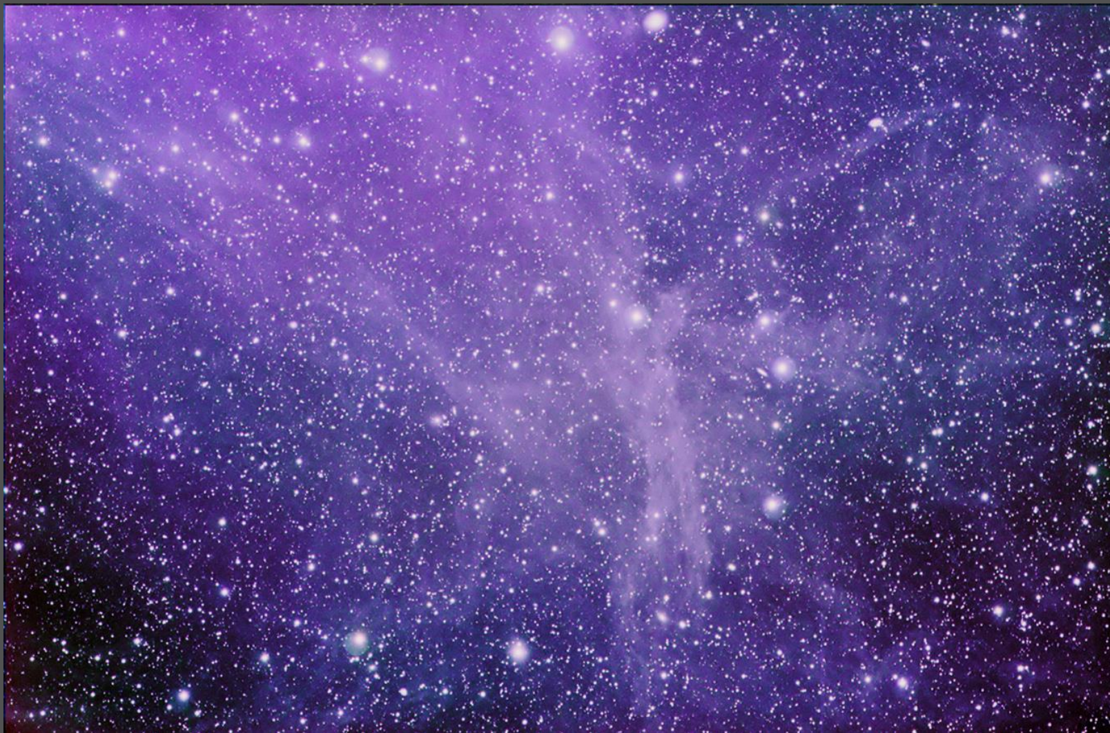
“Angelova meglica”

Avatamsaka sutra (Sutra cvetlične girlande), mahajanska “biblija”: vesoljna narava kot “Indrova mreža” razsvetljenih bitij – svetloba in neskončnost, eno in mnogo