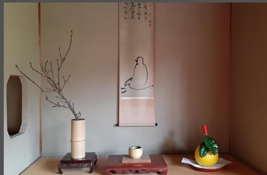
niša tokonoma z Darumo (na zvitku), ikebano ...