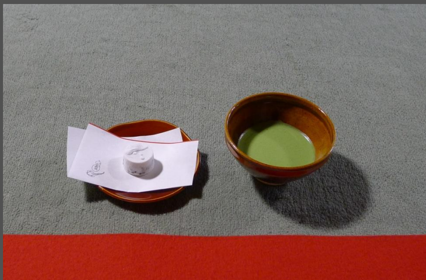
zeleni o-cha in sladek minjon