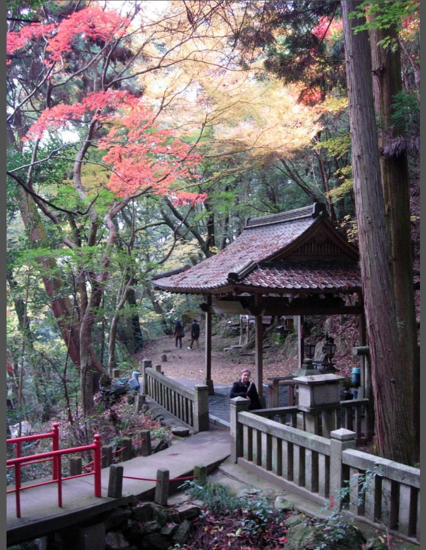
zunani tempelj, pred notranjim