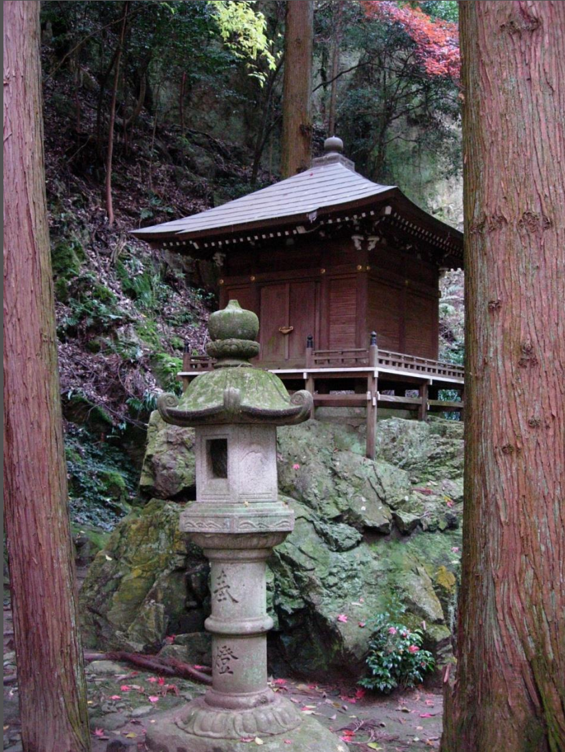
“notranji tempelj“ (kar pomeni oku-no-in )