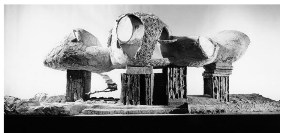
Friedrich Kiesler: Model za neko Neskončno hišo, New York, 1959