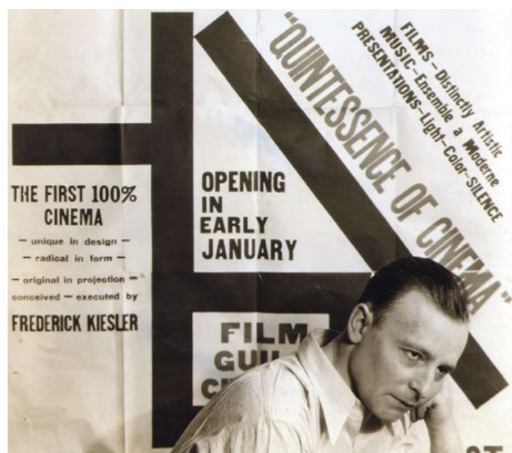
Friedrich Kiesler pred plakatom, ki napoveduje odprtje kinematografa Film Guild Cinema v New Yorku, zgradbe, za katero je izdelal načrt v letih 1929 in 1930.

V tem delu izraelskega muzeja hranijo najpomembnejše zaklade Izraela. Tudi sama zgradba velja za biser arhitekture 20. stoletja. Njenemu glavnemu arhitektu Friedrichu Kieslerju so pred meseci v dunajskem muzeju MAK posvetili veliko razstavo, ki je opozorila na opus tega nenavadnega umetnika.