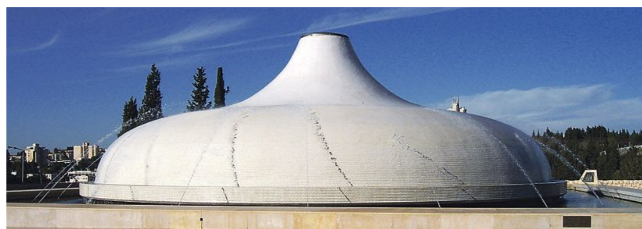
Svetišče knjige v Jeruzalemu je Kieslerjevo najpomembnejše uresničeno arhitekturno delo.

V Izraelu je na ogled več turističnih zanimivosti, ki ne spadajo med biblijske ali zgodnjekrščanske znamenitosti, ampak med zgradbe sodobne arhitekture. Ena od pogostih postaj na turističnih ogledih je Svetišče knjige v Jeruzalemu tik zraven kneseta, izraelskega parlamenta.