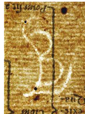
vodna znaka in dodatni vodni znak