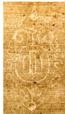
vodni znak na spojnih listih