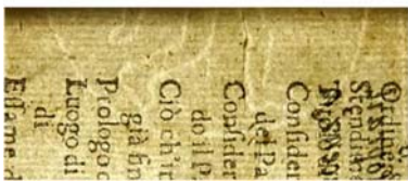
sestavljen vodni znak 1. dela