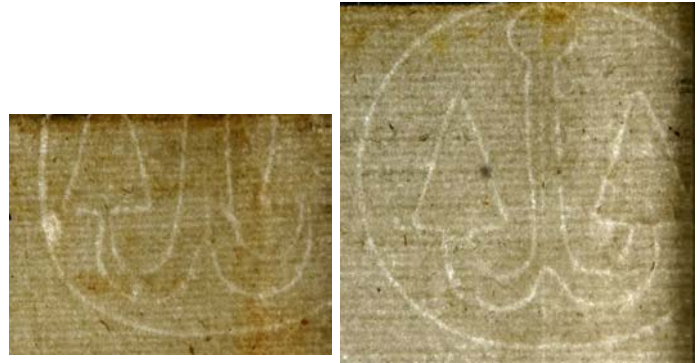
dela vodnih znakov - dvojčkov