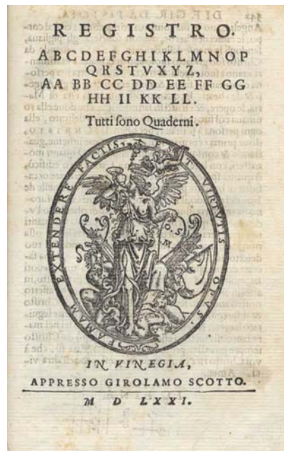
Register, signet in kolofon

izvor na prednjem prostem spojnem listu žig Biblioteca civica Pirano, na hrbtu nalepka Civica biblioteca Pirano z oznako n 5/16