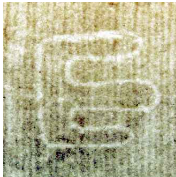
vodni znak na spojnih listih