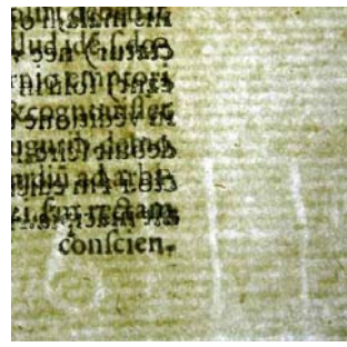
dodatni vodni znaki