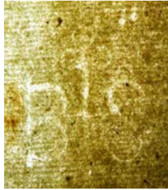
dodatni vodni znak na spojnih listih