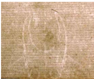
vodni znak na spojnih listih